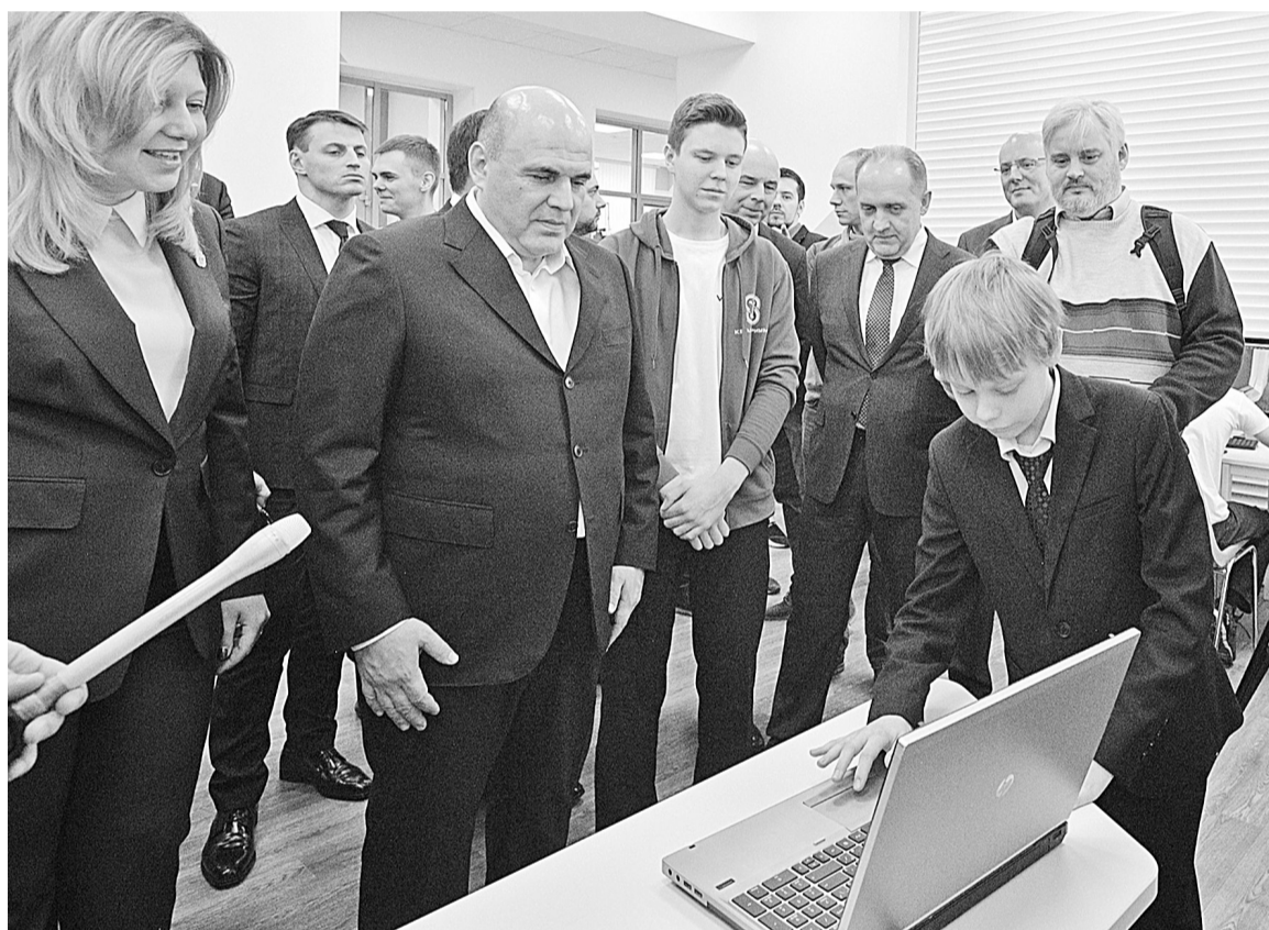
Глава российского правительства Михаил Мишустин первым делом посетил новгородский «Кванториум».

Свою первую рабочую поездку глава российского правительства Михаил Мишустин совершил в Новгородскую область