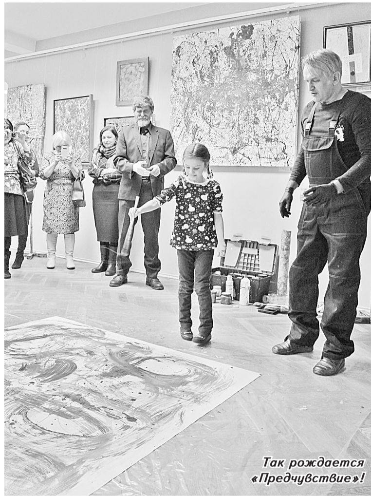
Так рождается «Предчувствие»!