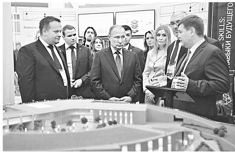
Презентация проекта Новгородской технической школы Президенту.

«Сетевые структуры важны — с их помощью можно добиться максимального эффекта. Чтобы понять, целесообразно ли в Великом Новгороде создавать технологическую долину, нужно знать, в каком состоянии находится отрасль. У вас — продвинутый губернатор. Пусть он придёт, ещё раз продемонстрирует, как и что делается и что ещё необходимо сделать для результата. Может, поэтично, но эту перспективную