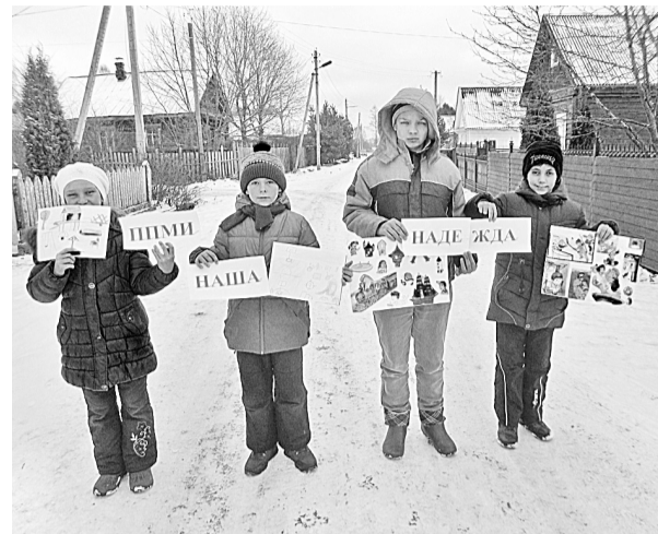
Юные жители Сушанского поселения надеются, что скоро у них появится современная детская площадка

В Новгородской области набирает обороты и скоро выйдет на финишную прямую проект поддержки местных инициатив граждан (ППМИ-2020).